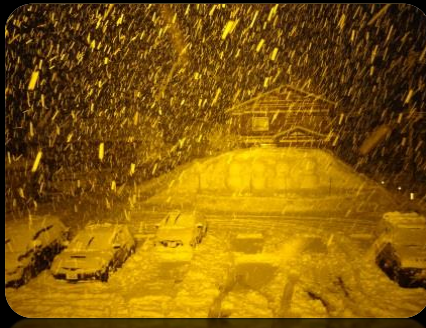
色温度変換フィルタ使用時