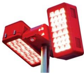
左右個別駆動機能