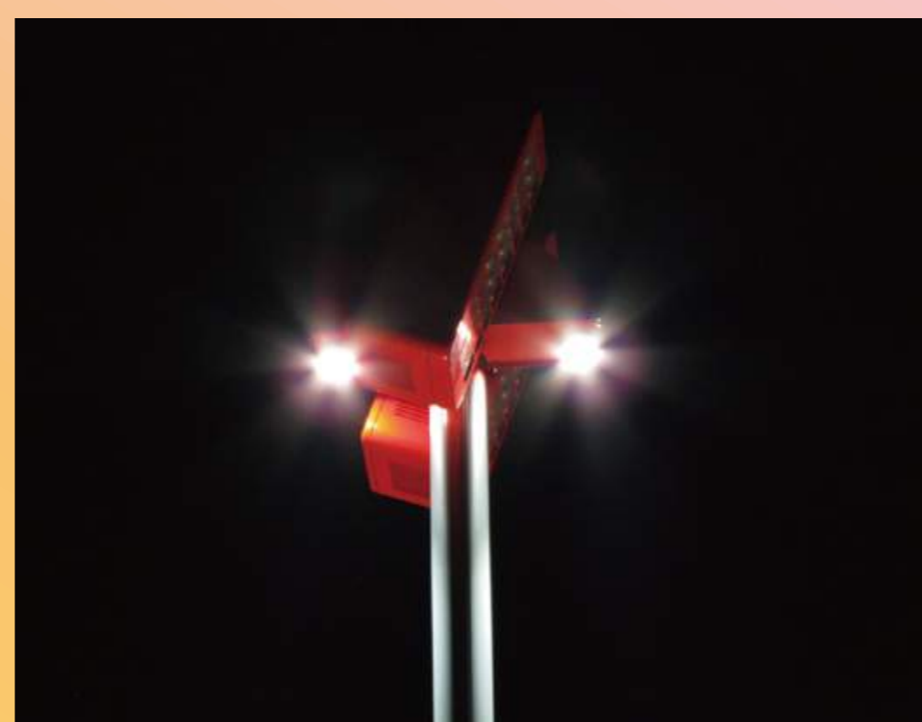
③ 周囲照明灯 点灯時