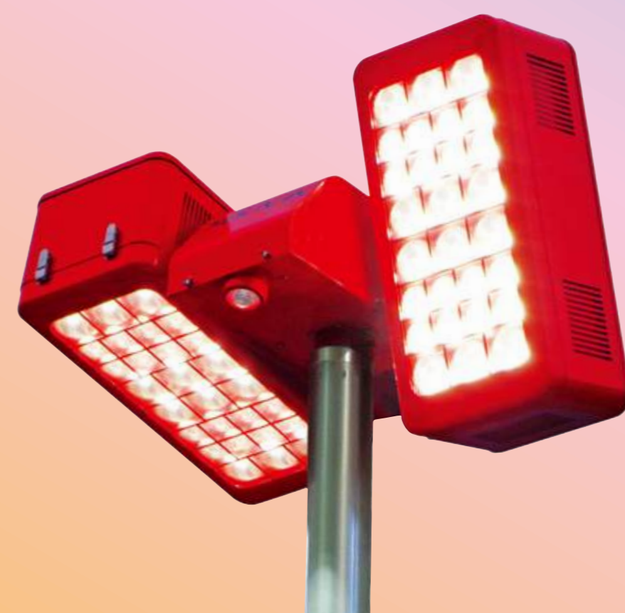
④ 左右個別駆動機能