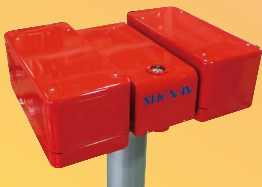
② 上方照明灯 点灯時